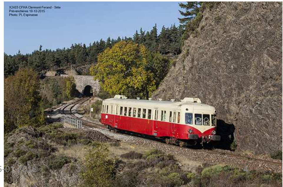
X2403 CFHA Clermont-Ferrand - Site Prévenchères 10-10-2015